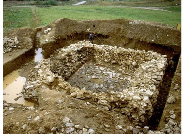
Izkopana grobna konstrukcija gomile v Razvanju pod Poštelo

Kakšna je bila družbena razslojenost v starejši železni dobi in kaj so to knežji pokopi?