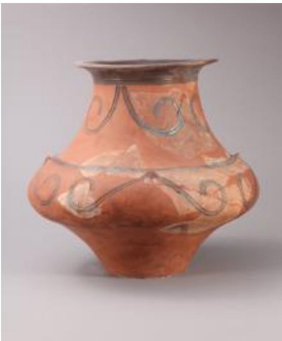
Lončena posoda, gradišče Poštela, hrani Pokrajinski muzej Maribor

Na začetku starejše železne dobe se je zaradi splošne uporabe železa in razvitih trgovskih stikov oblikoval izrazit vodilni sloj prebivalcev. V svojih rokah je združeval gospodarsko, politično, vojaško in duhovno oblast. Ta vrhnji sloj prebivalcev imenujemo halštatski knezi. Osnovna celica družbe je bila družina oziroma rod. Več rodov pa je sestavljalo skupnost, ki ji je načeloval starešina – knez. Zaradi verovanja v posmrtno življenje so svoj status izkazovali s prestižnimi grobnimi pridatki: v moških grobovih bojna oprema, kovinske posode, konjska oprema in bogata lončenina, v ženskih pa ob lončenini tudi nakit iz bronu, železa, jantarja, steklenih jagod in zlatih listov.