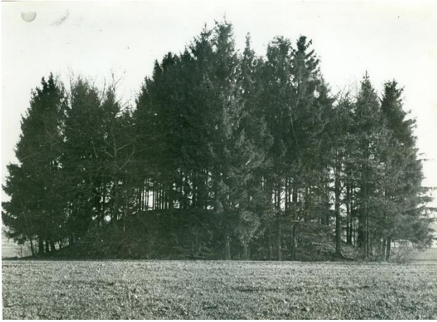
Gomila v Pivoli