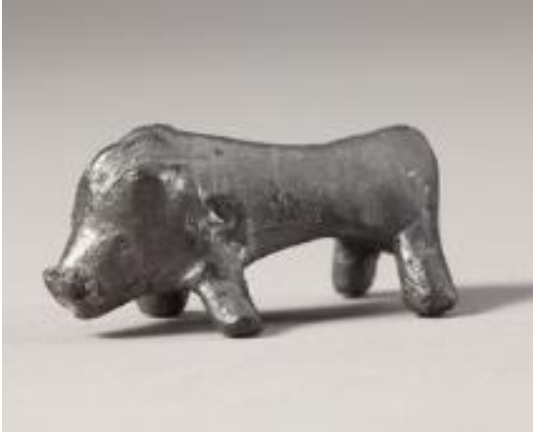
Bronzasti veper, Brinjeva gora, hrani Pokrajinski muzej Maribor

zapestnice, nanožnice in igle. Orožje, ki so ga pridali pokojnemu bojevniku, je bilo pogosto obredno enkrat ali večkrat uvito, zlasti meči, nožnice, sulične osti, noži, ščitne grbe pa so bile zmečkane.