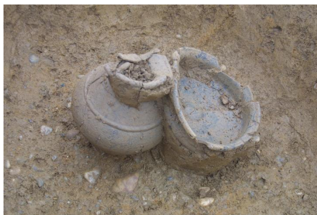
Lončenina v grobu 2, Orehova vas

Ali veste, katero obrt so Kelti izvrstno obvladali?