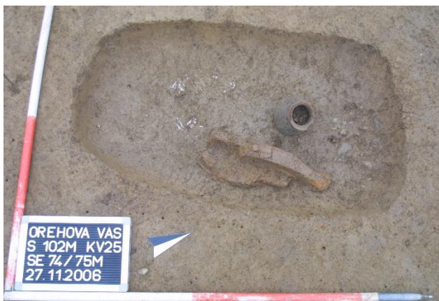
Grob 1, Orehova vas