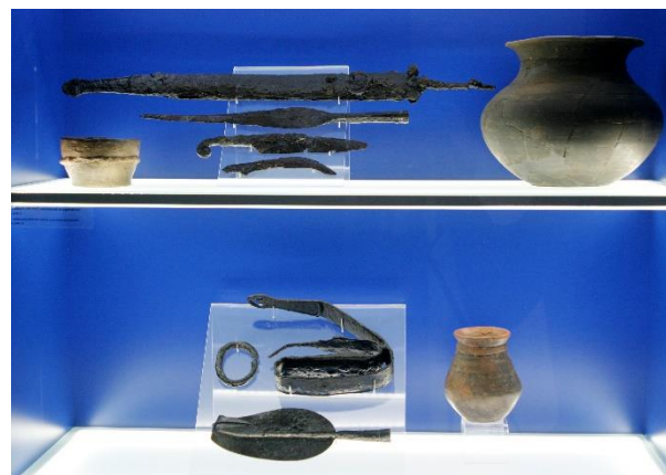
Pogled v stalno arheološko razstavo Prvi dotik Pokrajinskega muzeja Maribor

Ali veste, katero pomembno spremembo so uvedli pri izdelovanju lončenine?