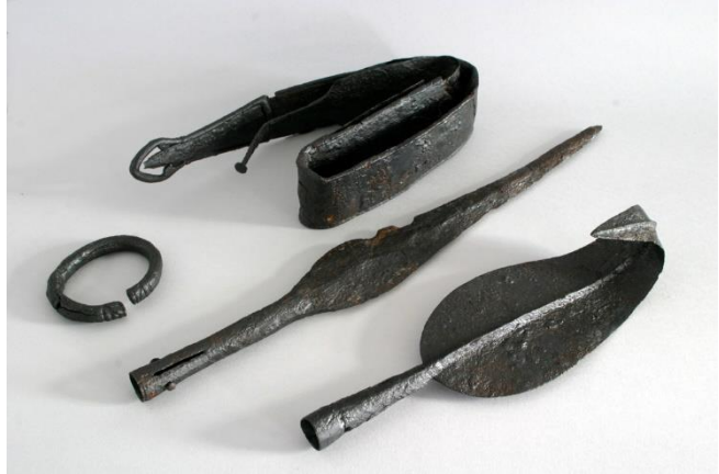
Železni meč, sulični osti in obroč, Orehova vas, hrani Pokrajinski muzej Maribor

Ali veste, zakaj je denarno gospodarstvo postopno nadomestilo poprejšnje naturalno gospodarstvo