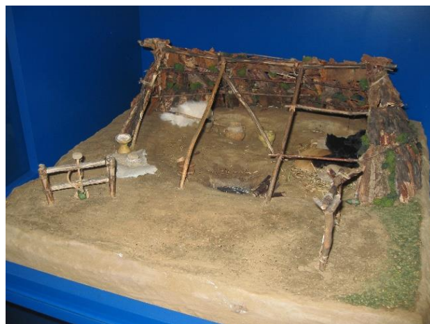
Poskus rekonstrukcije bivališča iz časa mlajše kamene dobe, maketa, Pokrajinski muzej Maribor