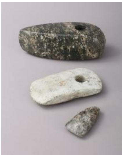
Kamnite sekire, Brezje in Radvanje, Maribor, hrani Pokrajinski muzej Maribor

Iz trdih kamnin, ki so jih poiskali v bližnjih potokih in rekah, so znali izdelati glajeno kamnito orodje. Kamen so brusili in gladili s pomočjo ostrega peska in vode. Luknje za nasaditev orodja na lesene ročaje so izvrtali s pomočjo posebne priprave - loka, ostrega peska in votlih kosti. Kako so to naredili? V lesen lok so vpeli votlo kost in pod njo postavili kamen. Z enakomernim premikanjem loka naprej in nazaj so ob pomoči ostrega peska v kamen počasi vrtali luknjo.