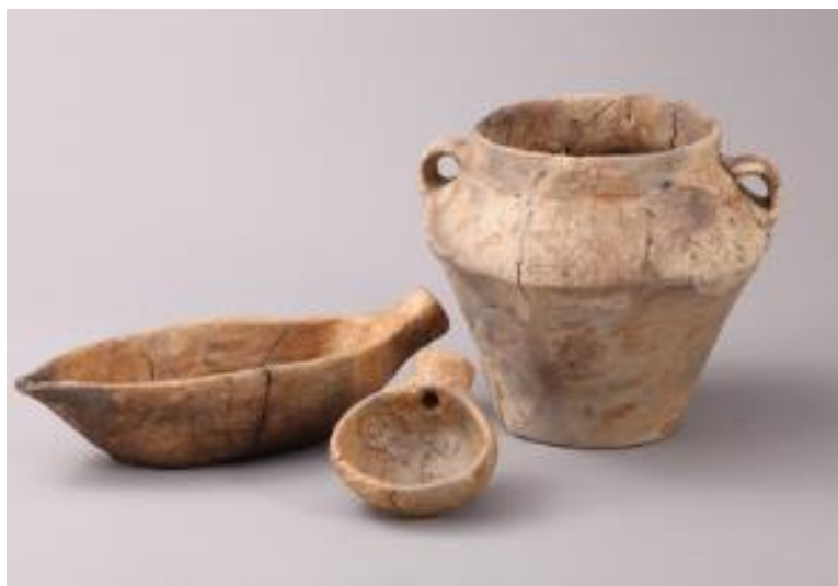
Lončenina, Radvanje, Maribor, hrani Pokrajinski muzej Maribor

Ali veste, s katerim pomembnim odkritjem so si ljudje v mlajši kameni dobi izboljšali pogoje življenja?