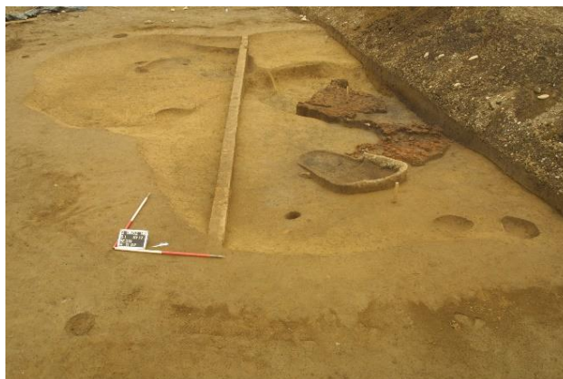
Pogled na ostaline bivališča z ohranjenimi deli ilovnatega premaza, Radvanje, Maribor, fotografija: arhiv ZVKDS OE Maribor