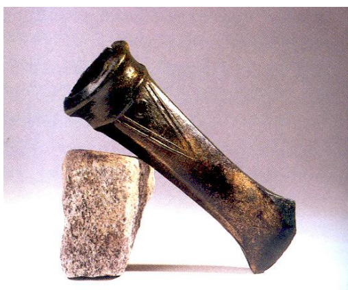
Bronasta tulasta sekira, depo Hočko Pohorje, hrani Pokrajinski muzej Maribor

Ali veste, kakšne vrste lončenih posod so poznali in kako so jih izdelovali v pozni bronasti dobi?