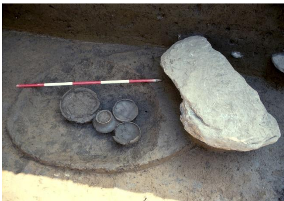
Žarni grob, Ruše

Pokojne so sežgali, pepel in nedogorele kosti pa položili v lončene posode – žare ali nasuli kar na dno grobne jame. Pogosto so jih pokrili s kamnitimi ploščami. Običajno je bil v jami pokopan en pokojnik. Grobovi se razlikujejo po številu in bogastvu pridanih posod ter kovinskih predmetov, ki so jih kot popotnico v onostranstvo položili k pokojniku. Med bronastimi predmeti prevladuje nakit, manj je orodja in orožja. Moškim so običajno dodali britve in igle, ženskam pa fibule, zapestnice, ovratnice, obročke in lončena predilna vretenca.