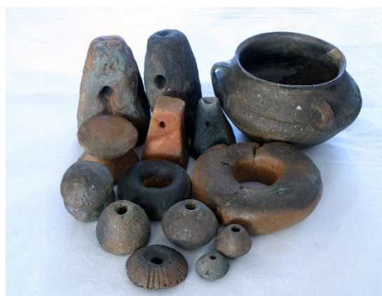
Lončenina, Brinjeva gora – Gračič, nad Zrečami, hrani Pokrajinski muzej Maribor