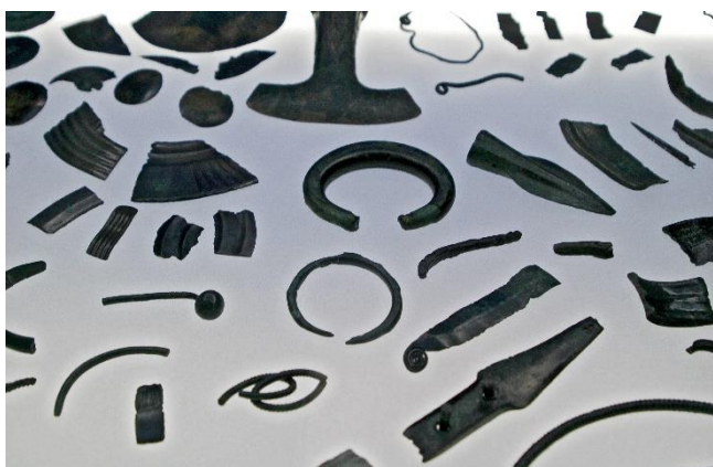
Bronasti predmeti, depo Hočko Pohorje, hrani Pokrajinski muzej Maribor

To so skupine bronastih predmetov (orožje, orodje in nakit), ki so jih tedanji prebivalci zakopali v zemljo na posebej izbranih mestih, vrgli v jame ali vodo. Dolgo časa so veljale za izgubljeno lastnino potujočih trgovcev in obrtnikov, ki so jo v nemirnih časih selitev ljudstev skrili v naglici. Danes nekaterim depojem pripisujejo tudi sakralno vlogo, v dragocenih predmetih pa vidijo darove, ki so jih takratni ljudje namenili svojim božanstvom, da bi uslišali njihove prošnje.