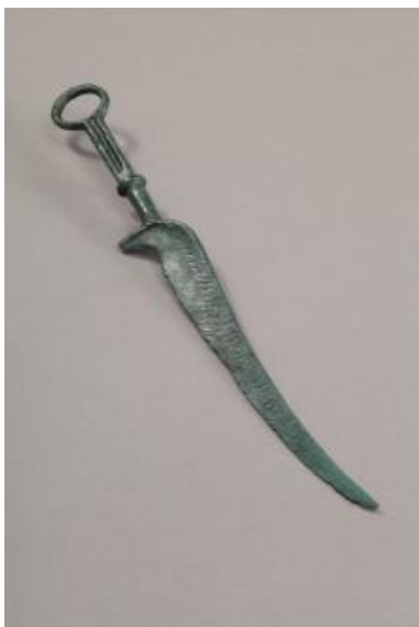
Bronast nož, Maribor, hrani Pokrajinski muzej Maribor

Zlitina je zmes dveh ali več kovin. Čeprav je človek že znal izdelati orodje iz bakra, z njim zaradi mehкости ni bil zadovoljen. So pa imeli že v 2. tisočletju pr. n. št. takratni prebivalci toliko znanja o pridobivanju kovin iz rude, da so z mešanjem že znanih kovin bakra in kositra v ustreznem razmerju začeli izdelovati zlitino bron. Tako je bron zaradi svoje trdnosti postal najpomembnejša kovina za izdelavo orodja, orožja in nakita.