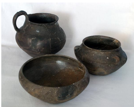
Lončenina, Brinjeva gora – Gračič, nad Zrečami, hrani Pokrajinski muzej Maribor

Domači lončarji so male in velike žare, amfore, vrče, lonce, sklede in skodele izdelovali prostoročno. Pogosto so jih okrasili z vrezanimi ali vtisnjenimi motivi, ki so jih zapolnili z belo barvo – inkrustacijo, ali so nanje nanесли plastično dekoracijo. Ni natančneje znano, katere posode so izdelovali izključno za pogrebno rabo, a v veliki večini gre gotovo za uporabno posodje, ki so ga ob smrti izbrali za drug namen. Velike žare so bile poprej shrambene posode za živila in vodo, manjše posode za kuho, sklede in skodele za uživanje jedi in pijač.