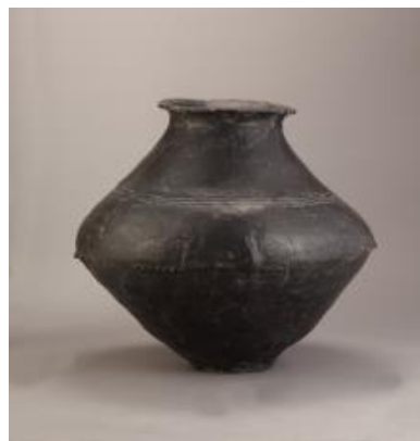
Lončena žara, Maribor, hrani Pokrajinski muzej Maribor