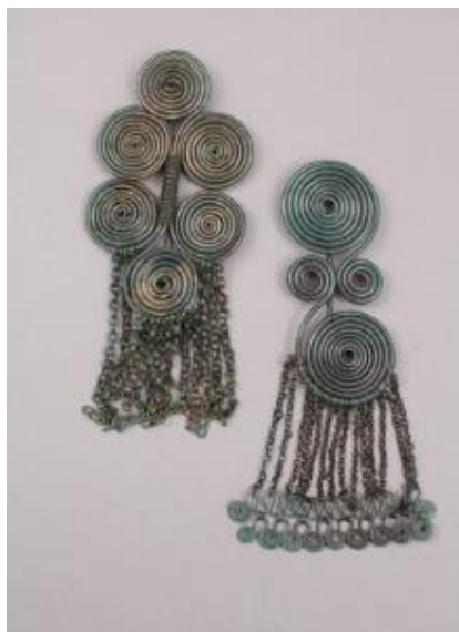
Bronasti fibuli, Pobrezje, Maribor, hrani Pokrajinski muzej Maribor