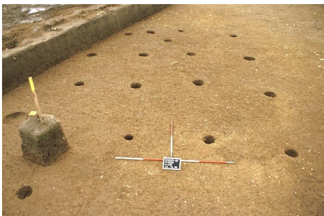
Jame za lesene nosilne stebre bivališča, Rogoza

dokazujejo, da so se poleg živinoreje pretežno ukvarjali s poljedelstvom. Lončene posode so izdelovali prostoročno. Najdbe kamnitih kalupov za vlivanje kovin kažejo na razcvet metalurške dejavnosti. Povečala se je blagovna menjava predmetov.