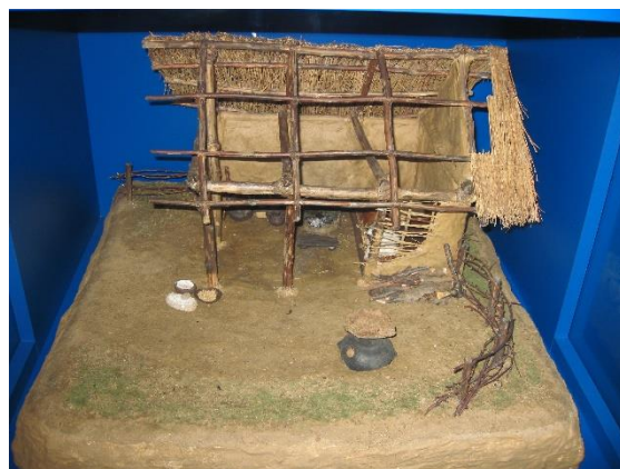
Poskus rekonstrukcije bivališča iz časa bronaste dobe, maketa, Pokrajinski muzej Maribor

Ali veste, kakšen način pokopa se je uveljavil v pozni bronasti dobi?